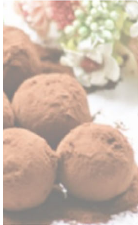
作る*牛乳でなめら yにゃんパカ